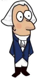
Carl von Linné Lineu (1707 - 1778)